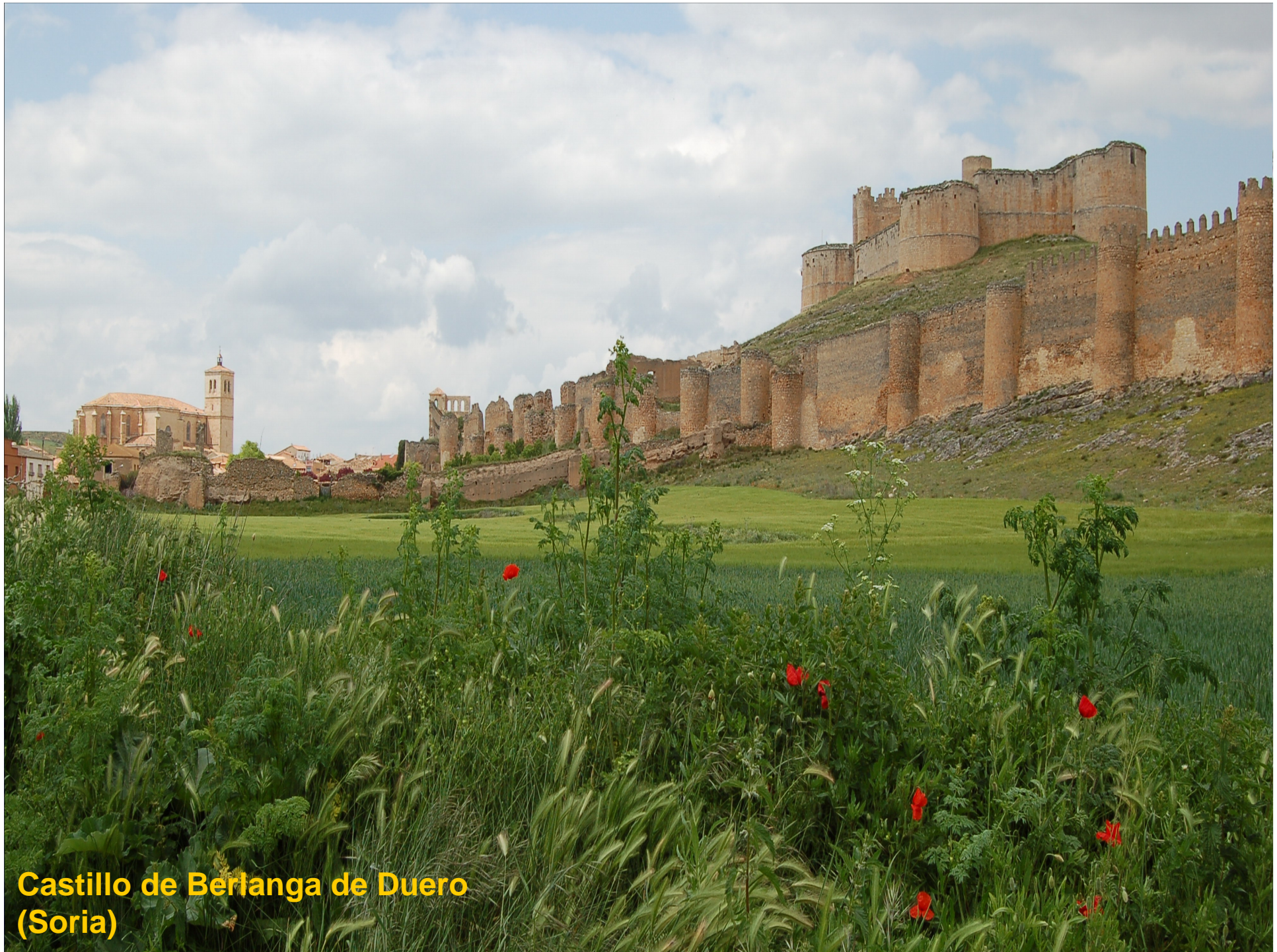
Castillo de Berlanga de Duero (Soria)