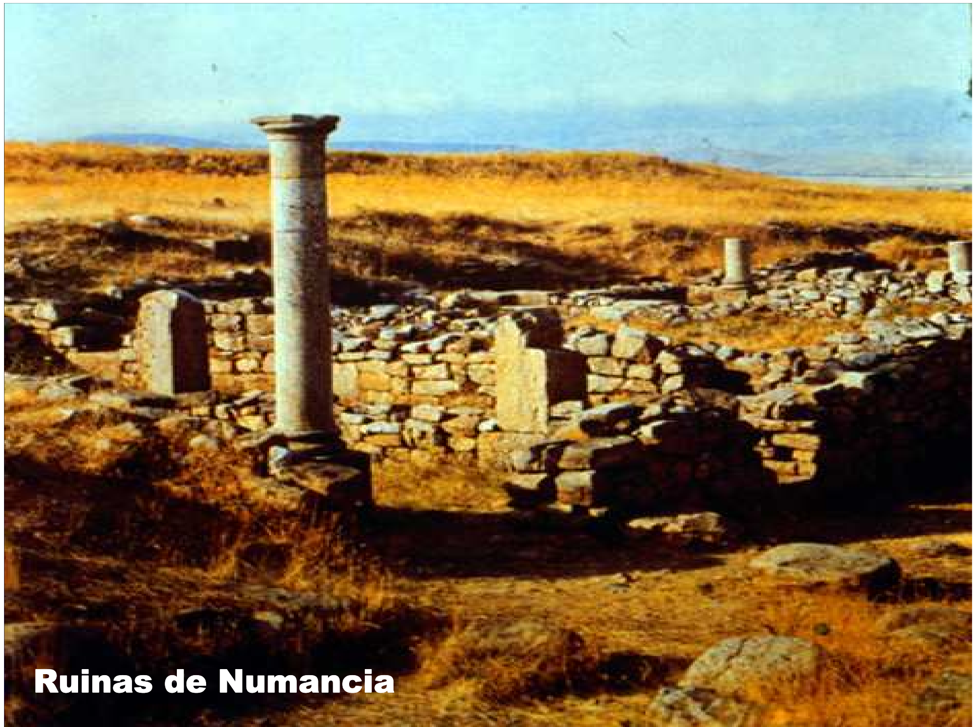
Ruinas de Numancia