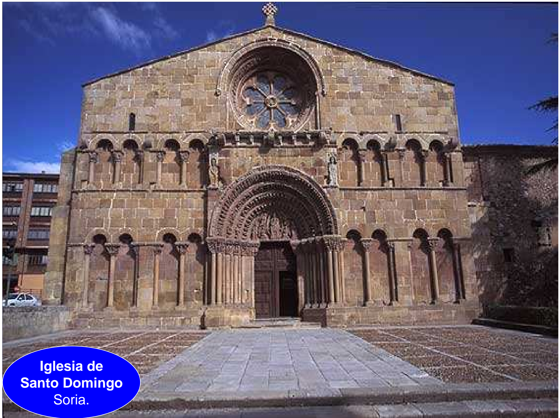
Iglesia de Santo Domingo Soria.