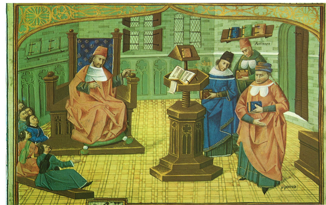
Enseñanza médica de Bernardo de Gordon. Por la derecha pasan Hipócrates, Galeno y Avicena. Manuscrito del siglo XV.