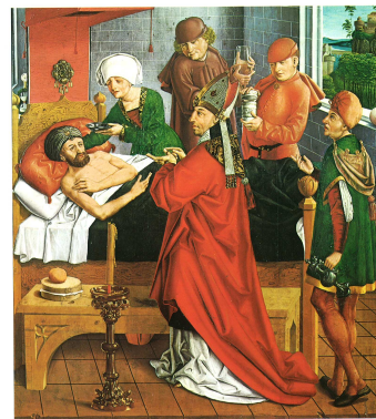
Guelfo, pintado por un artista desconocido. Biblioteca Apostólica Vaticana, Museo Histórico Vaticano, Roma.

“Velar para que el ejercicio de la profesión se adecue a los intereses de los ciudadanos”