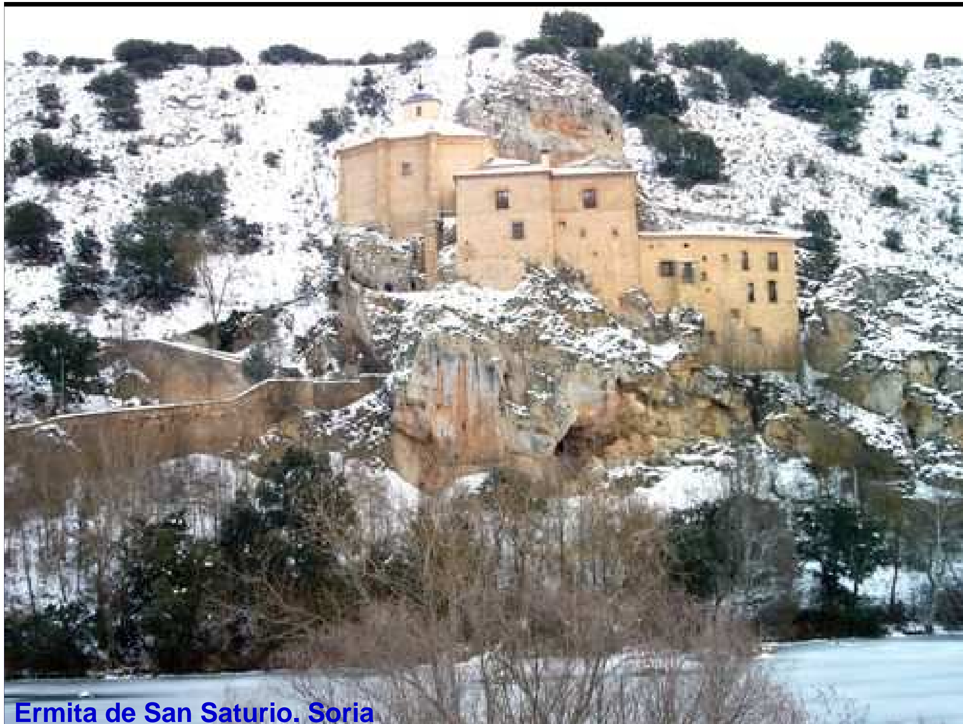
Ermita de San Saturio. Soria